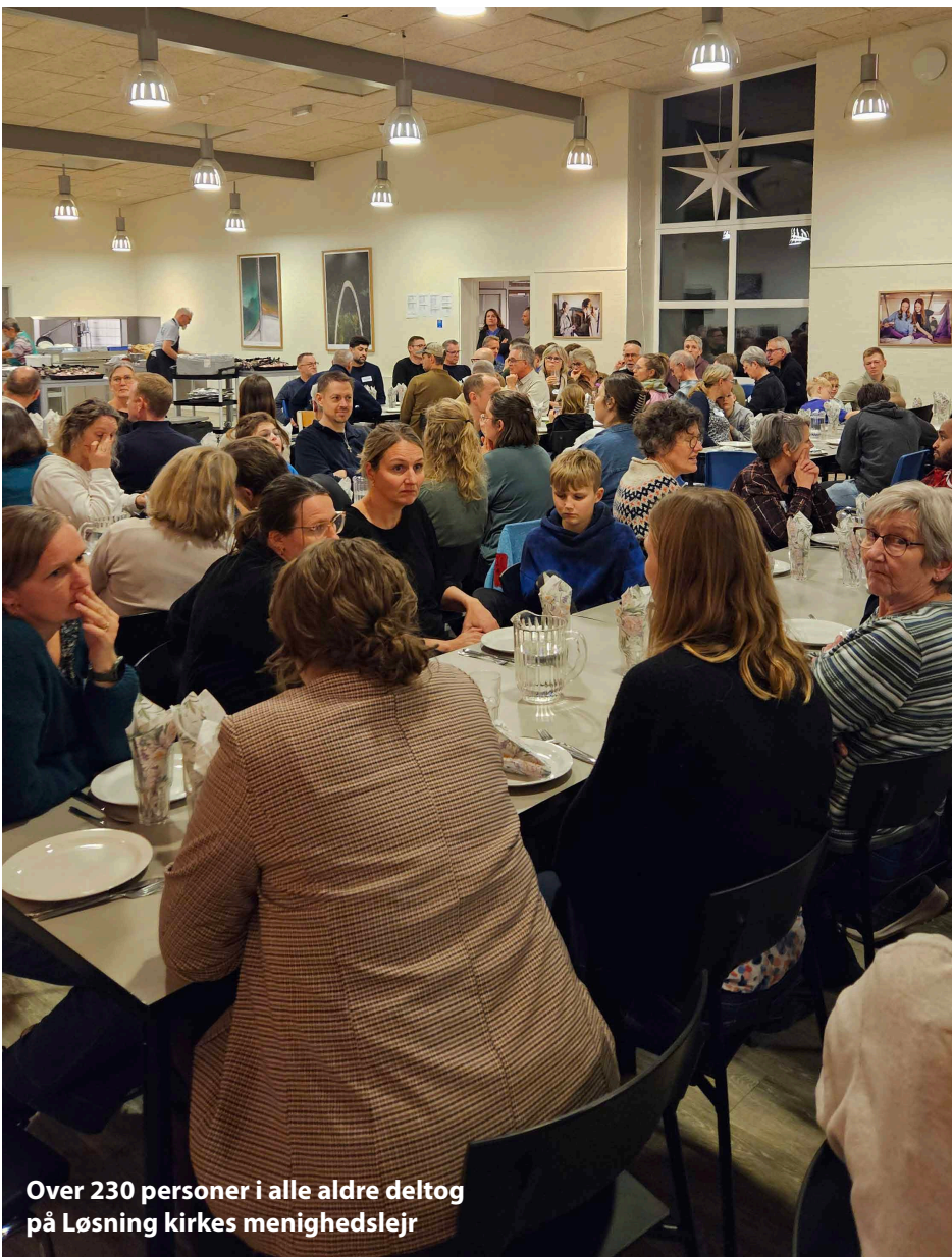
Over 230 personer i alle aldre deltog på Løsning kirkes menighedslejr